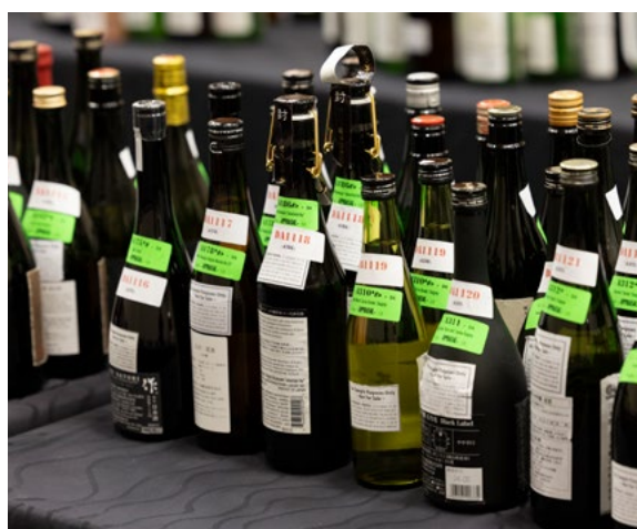
準備室に並ぶ酒瓶

全米日本酒飲評会では、2017年度から全ての出品部門においてグルコース濃度を事前に測定し、出品酒の並び順決定の要素として取り入れています。従来の酸度順に並べての官能審査では、甘さの強い出品酒の隣に甘さが控え目の出品酒が並んだ場合、後者の出品酒が印象的に弱くなり、評価が比較的低くなってしまいう傾向がありました。グルコース濃度を考慮した並び順を取り入れることで、先述の懸念を軽減したことを確認しており、2026年度もこの方式を継続いたします。