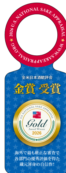
ボトル首掛け型POPイメージ