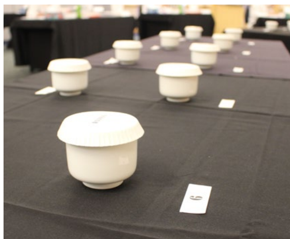
蛇の目カップは香りの確認用のみ使用されます。

全米日本酒飲評会は、独立行政法人酒類総合研究所から毎年2名の審査員にご参加いただいております。審査はこの2名を含め、通常日本国内から9名、日本国外から2名、合計11名の経験豊富な方々を審査員に迎えています。全米日本酒飲評会では、審査員全員が全ての出品酒のテイスティングを同時に行うため、偏りのない公平な審査が実施されます。