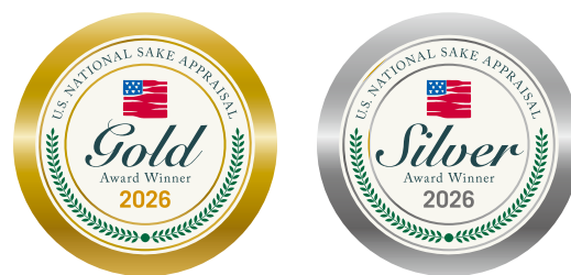
受賞シールイメージ