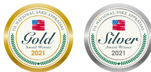
受賞シールイメージ