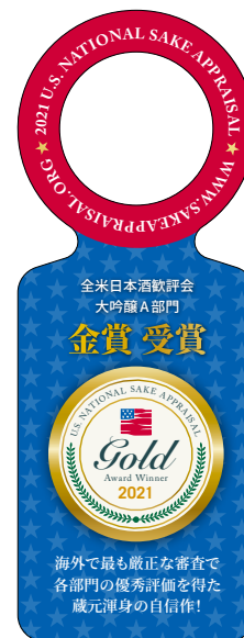
ボトル首掛け型POPイメージ